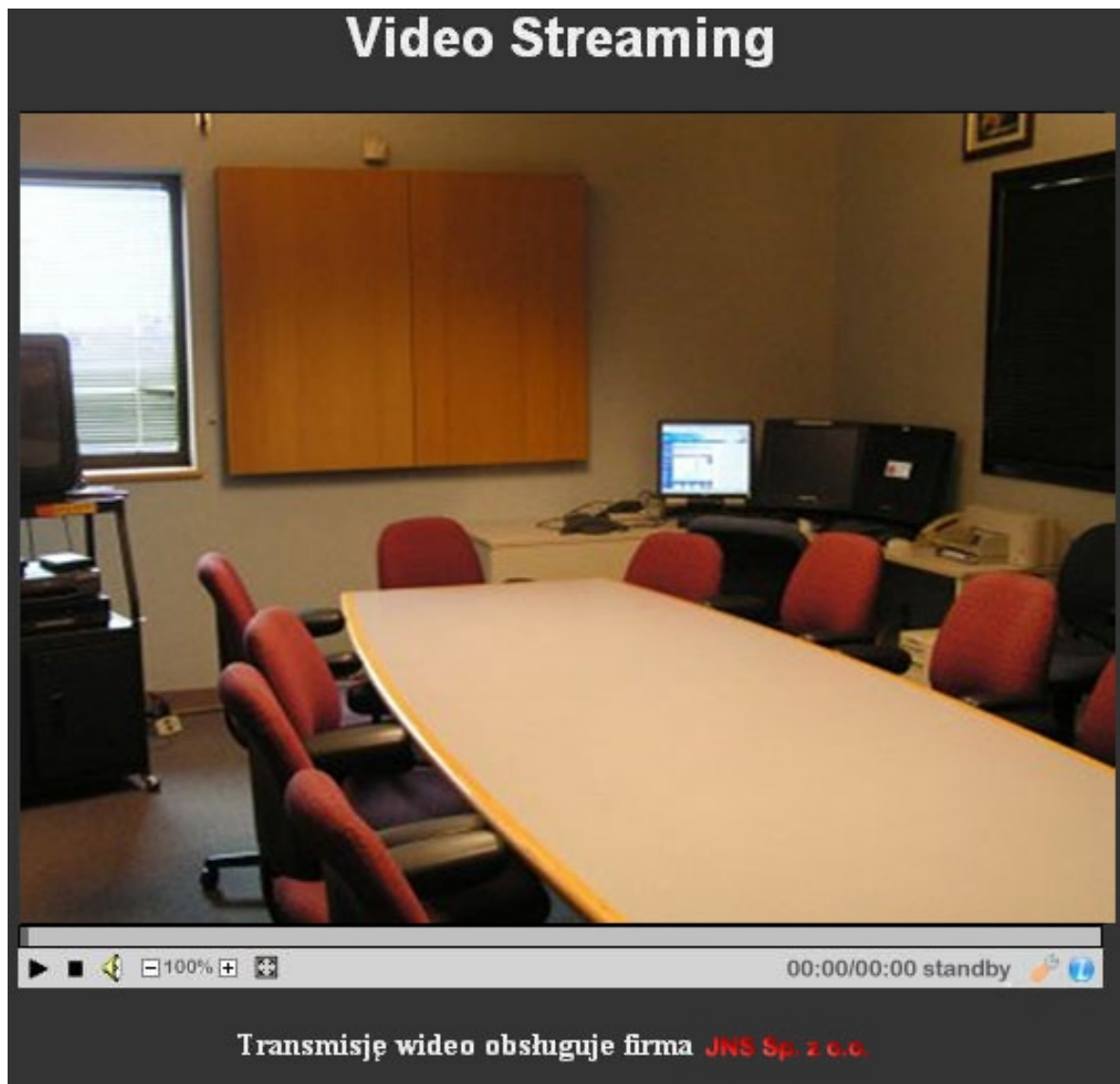
Rys.2 Okno widoku w Systemie Live Streaming.